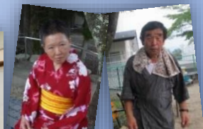
浴衣美女♀甚平美男♂がせいぞろい！！いい笑顔です☆