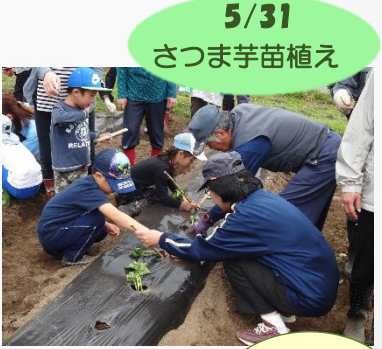
5/31 さつまいも苗植え