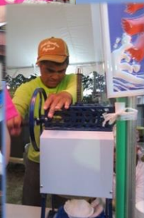
手作りかき氷も大変！暑さがとても癒されました☆ ありがとう！