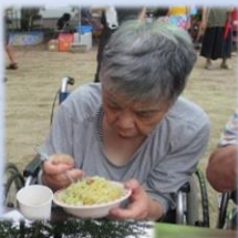
おなかいっぱい食べました♡ おいしかったよ☆