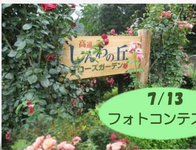
7/13 フォトコンテスト